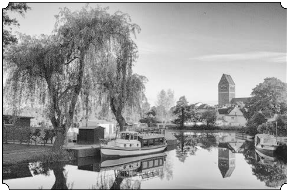
Hafen am Fischerdamm